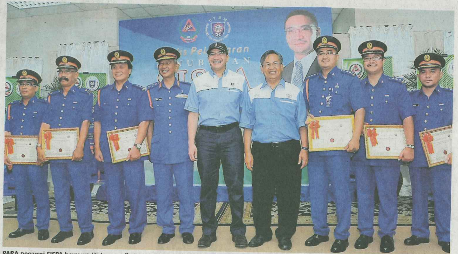
PARA pegawai SISPA bersama Hishammuddin Tun Hussein di UTHM, baru-baru ini.

Baru-baru ini, katanya, Menteri Dalam Negeri, Datuk Seri Hishammuddin Tun Hussein yang juga Menteri Mentor UTHM telah merasmikan Majlis Pelancaran Penuh SISPA di UTHM, Batu Pahat.