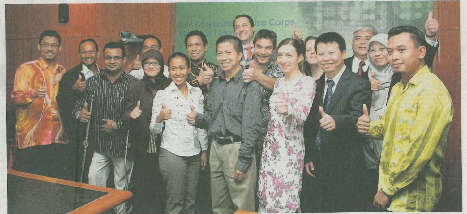
SUKARELAWAN IBM dan kakitangan UTM pada majlis penutup program khidmat sosial korporat di UTM, Johor Bahru, baru-baru ini.

"Meskipun dua sukarelawan hanya sempat bersama saya dalam projek membina model 'Carbon Footprint' dalam tempoh